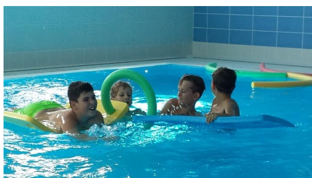
Učíme se hrát vodní pólo.