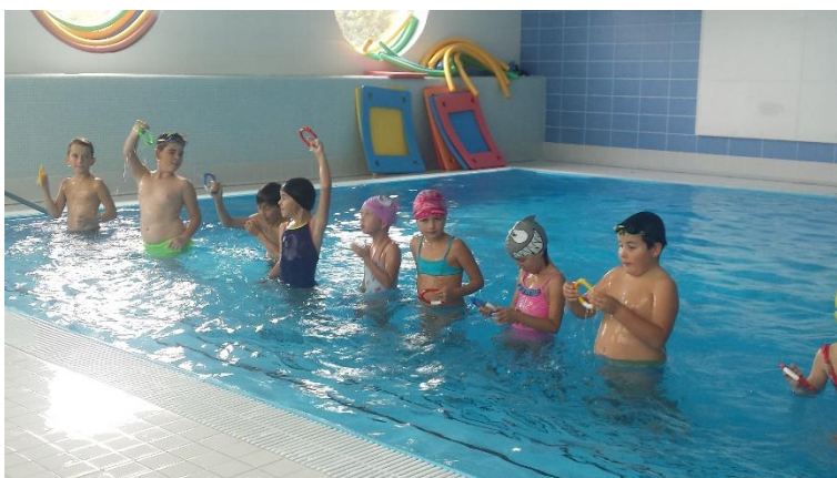
Lovení ryb. Nebojíme se potopit.