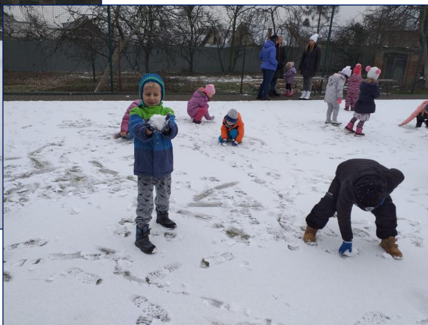
Škoda, že ten sníh byl jenom pár hodni. Ale užili jsme si to i tak.