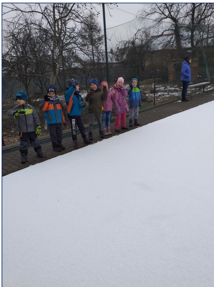
Už jsme se těšili, jak se proběhneme na prvním sněhu.